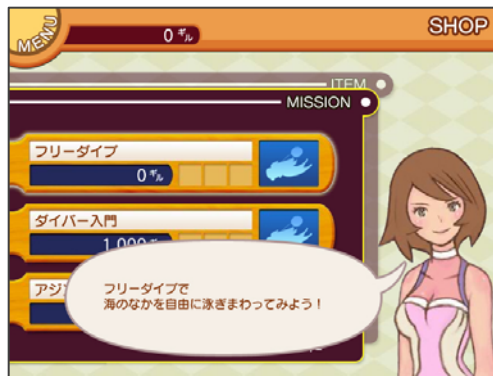
大会に用意された多彩なミッション 「フリーダイブ」でギルをためてチャレンジしよう！