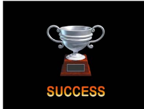
目指せダイブマスター！