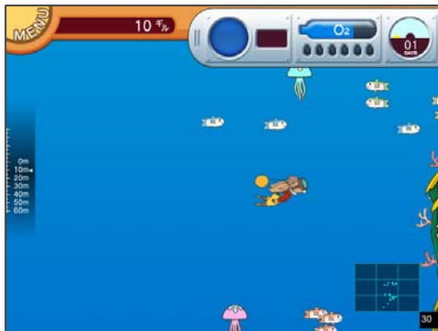
DIVE すると、そこはまるで南国の海！