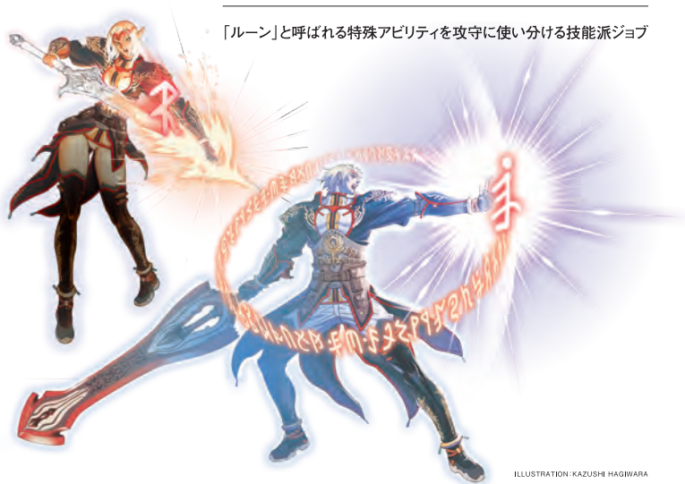
ILLUSTRATION: KAZUSHI HAGIWARA